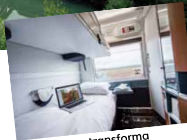
La cabina se transforma de asientos a literas.

en las categorías: Sleeper Plus y Economy class. Cuentan con un baño que es toda una experiencia, es un espacio pequeño que alberga un lavabo con espejo, el inodoro y la regadera. El agua