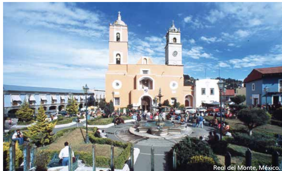
Real del Monte, México.

Cumpliendo con esos elementos y con las reuniones y discusiones que se realicen en el marco de la OEA, entonces ya podrán definir los