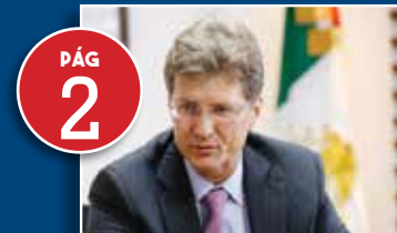
Enrique de la Madrid.

Setur: La construcción del nuevo aeropuerto no está a discusión, porque es una decisión ya tomada del gobierno.