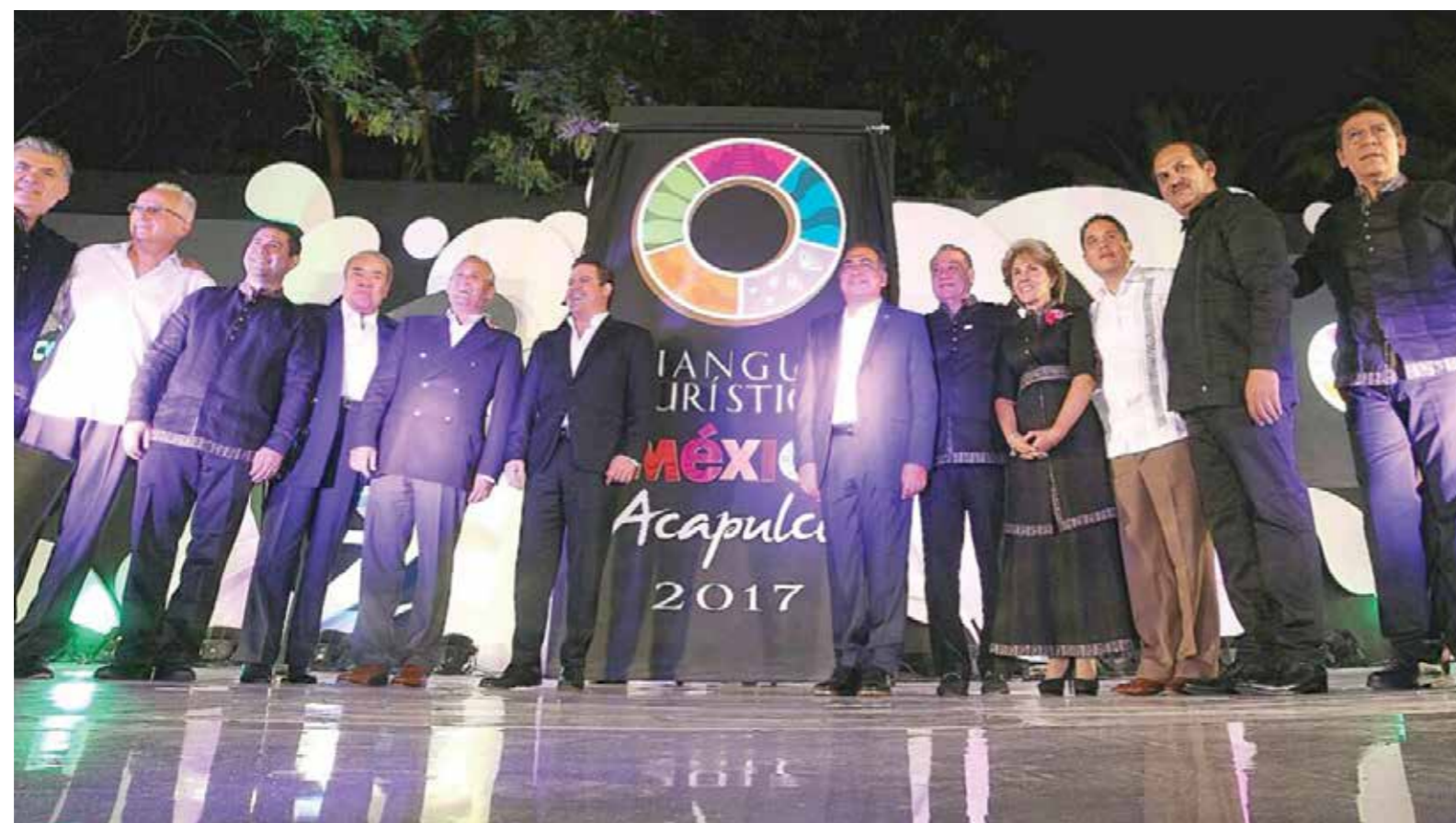
Cambio de estafeta entre los gobernadores de Jalisco y Guerrero, Jorge Aristóteles Sandoval Díaz y Héctor Astudillo Flores, respectivamente.

Zozaya agregó que con esta respuesta no busca realizar una campaña de desprestigio para el desti-